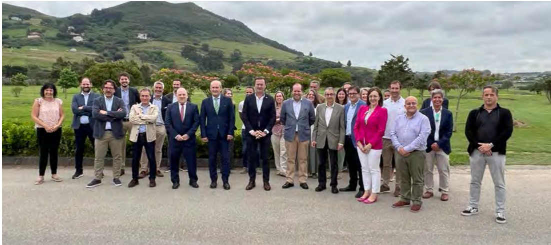
Foto de familia dos representantes das distintas empresas públicas participantes neste evento, xunto co conselleiro de Medio Ambiente de Cantabria

Coincidiron representantes de compañías asentadas na Cornisa Cantábrica: MARE SOGAMA, COGERSA e GHK