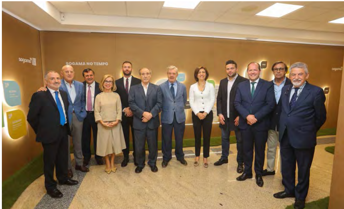
Visita de los invitados a la nueva exposición en el Complejo Medioambiental de Cerceda.

El pasado mes de junio, en el marco del Día Mundial del Medio Ambiente, Sogama conmemoró su 30 aniversario convocando a todos sus presidentes, entre los que, por supuesto, usted se encontraba. ¿Qué le reportó esta jornada?